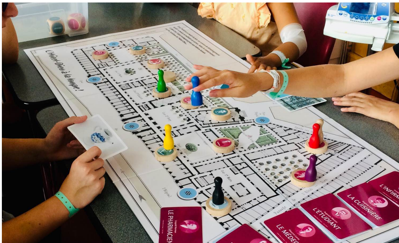
Séance du jeu L'Hôtel-Dieu à la loupe, Bron, Musée des Hospices Civils de Lyon

Ouverture des jeunes vers des collections hospitalières, un hôpital ancien, les objets du passé. Ouverture semblable constatée chez des professionnels de l'animation en contexte hospitalier et chez les professionnels du soin.