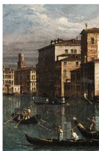
Bernardo Bellotto Le Grand Canal à Venise (détail), vers 1736-1740, huile sur toile