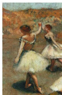
Edgar Degas, Danseuses sur la scène (détail), vers 1889, huile sur toile