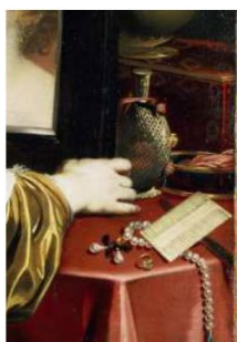
Nicolas Régnier, Jeune femme à sa toilette (détail), 1626, huile sur toile

Jumelage musée des Beaux-Arts / Centre Hospitalier Saint Jean de Dieu