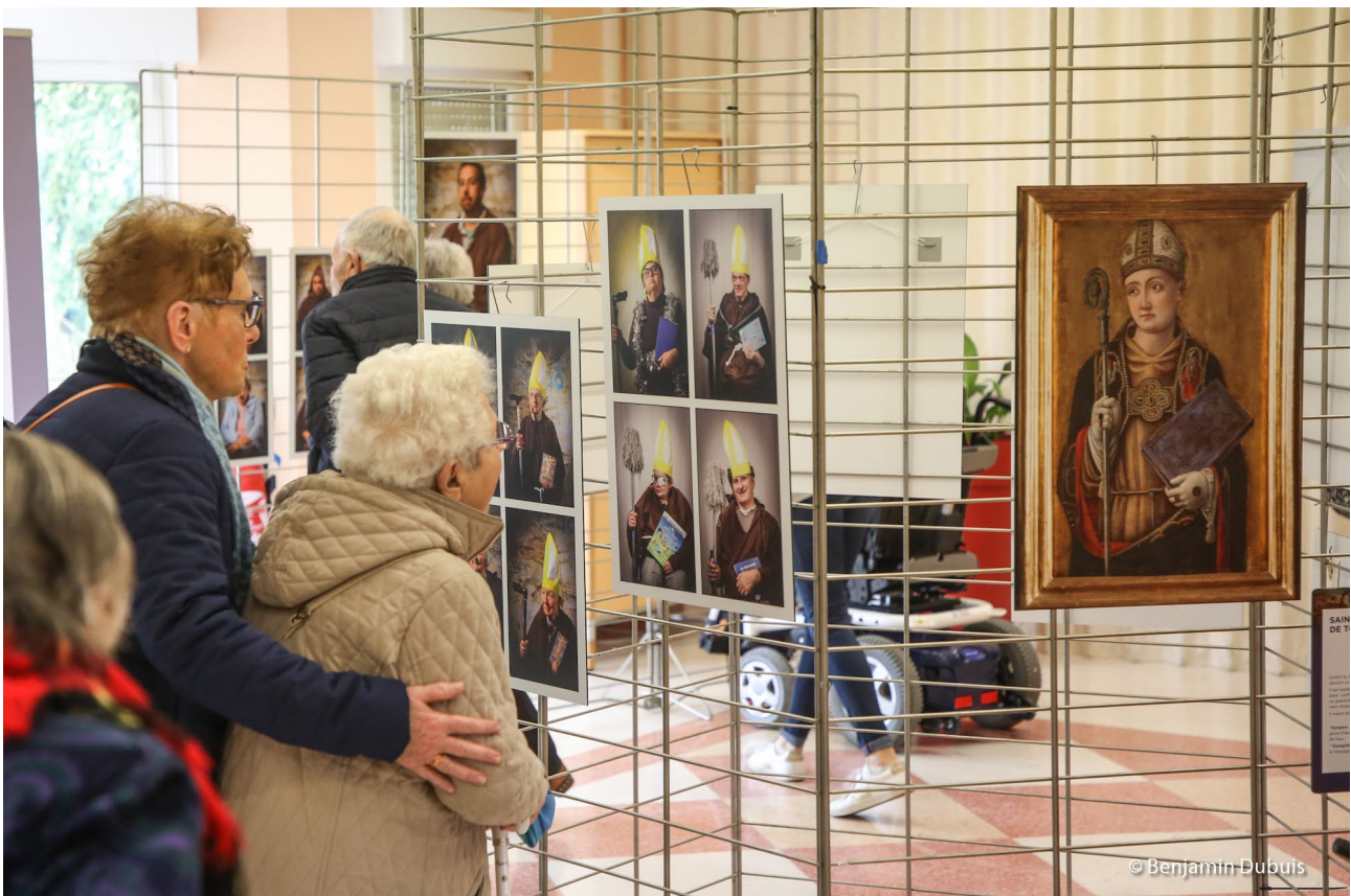
Vernissage de l'exposition autour des oeuvres du musée des Beaux-Arts de Tours au foyer de l'ADAPEI, les Haies Vives à Joué-les-Tours