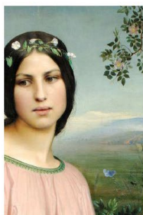
Louis Janmot Fleur des champs (détail), 1845, huile sur bois