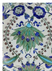
Anonyme, Iznik (Turquie), Plat à marli chantourné (détail), 16 e siècle, céramique peinte