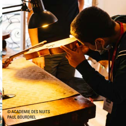
© ACADEMIE DES NUITS PAUL BOURDREL