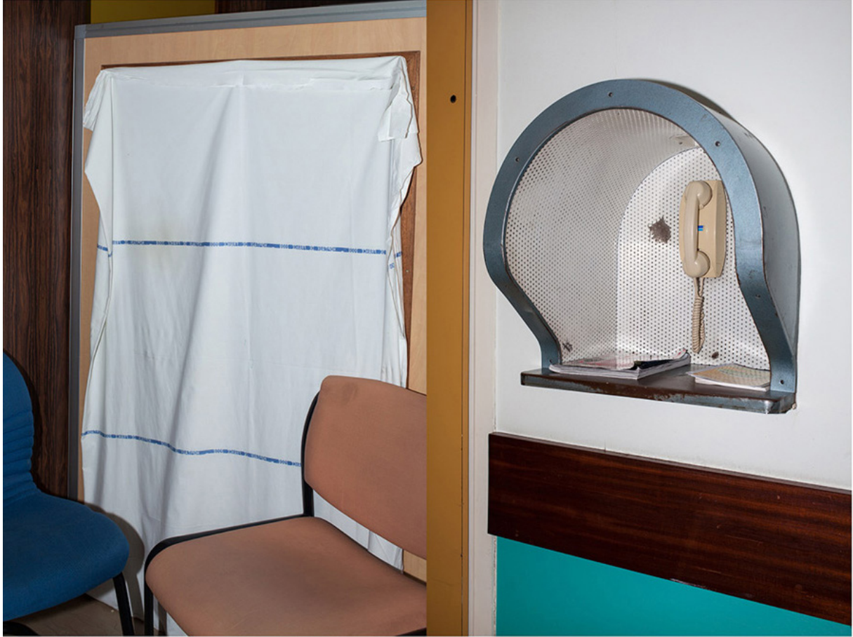
© Patricia Almeida, série Tahiti, je reste ici , Centre hospitalier Métropole Savoie, 2015