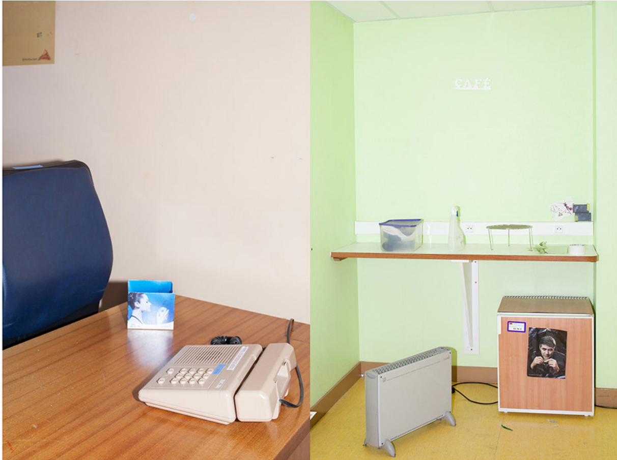
© Patricia Almeida, série Tahiti, je reste ici , Centre hospitalier Métropole Savoie, 2015