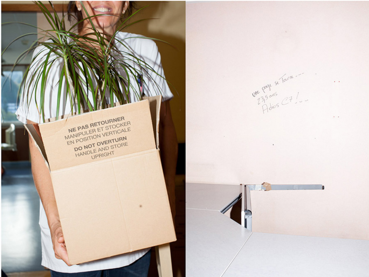
© Patricia Almeida, série Tahiti, je reste ici , Centre hospitalier Métropole Savoie, 2015

murs, des sols ou encore la texture du mobilier et des objets décoratifs, semble ici sublimée par une prise de vue au cadrage désorienté mais évocateur d'une certaine vision de l'hôpital de l'époque. Tahiti, je reste ici , est une série photographique qui évoque le voyage et le changement, et qui rend compte des marques de la vie d'un espace de travail et de passage pour des milliers de patients, visiteurs, médecins, infirmiers ou administratifs.