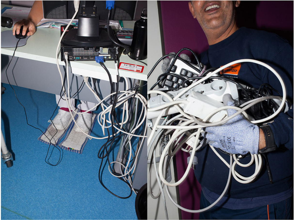
© Patricia Almeida, série Tahiti, je reste ici , Centre hospitalier Métropole Savoie, 2015