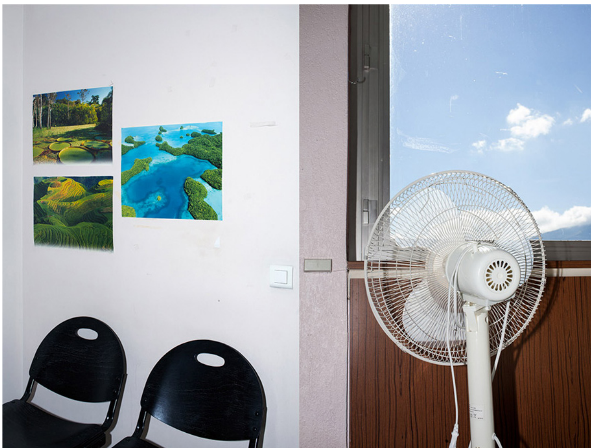
© Patricia Almeida, série Tahiti, je reste ici , Centre hospitalier Métropole Savoie, 2015