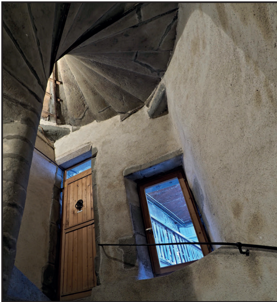
Une montée d'escalier de la rue Sainte Claire