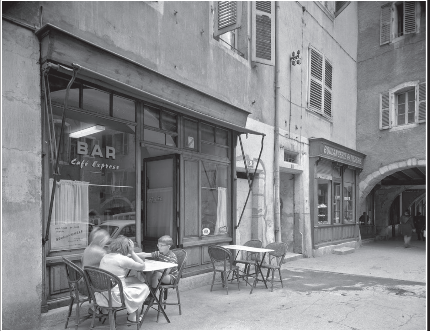
BAR Café Express, Mr TISSOT-DUPONT