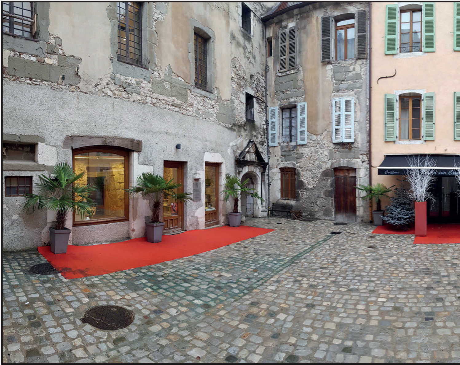
La cour BAGNORÉA