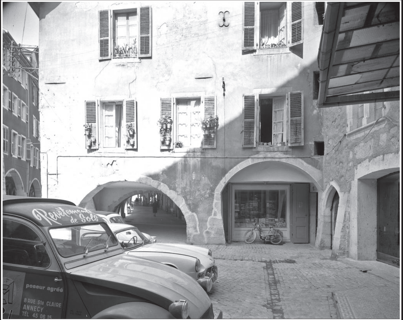
“LE CARRÉ” de la rue Sainte Claire