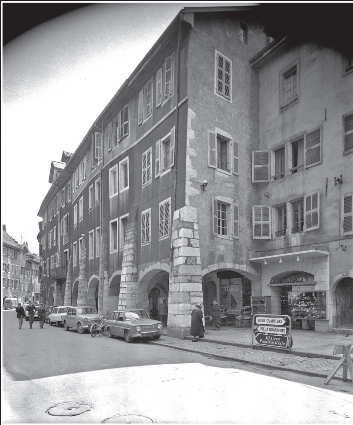
Le côté impair de la rue Sainte Claire