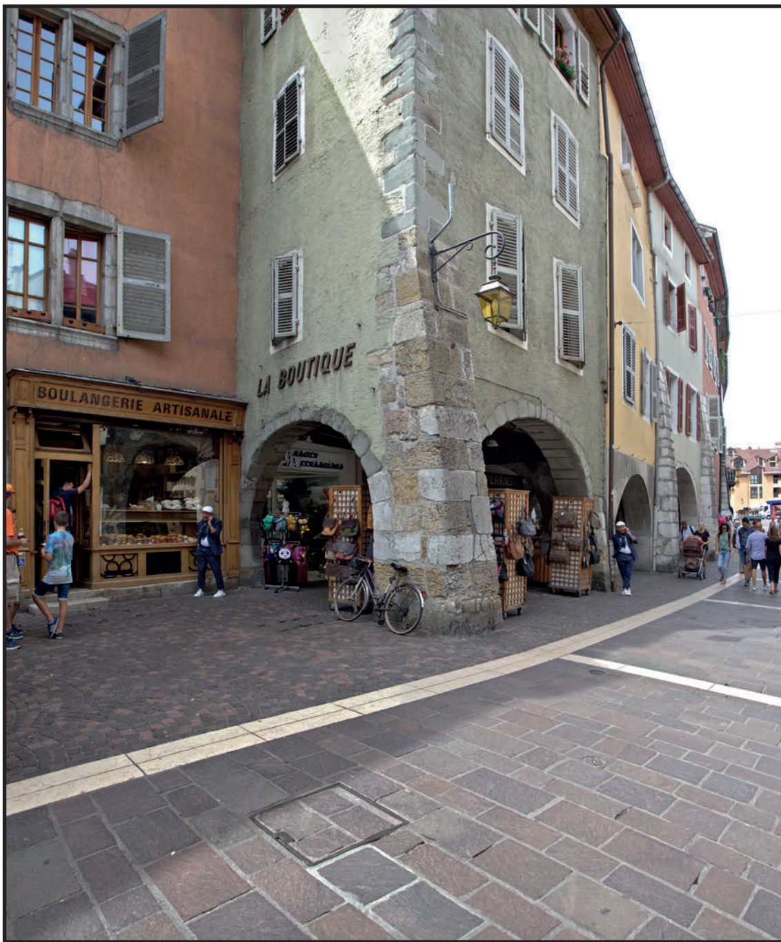
La rue Sainte Claire avec l'ensemble immobilier La Manufacture