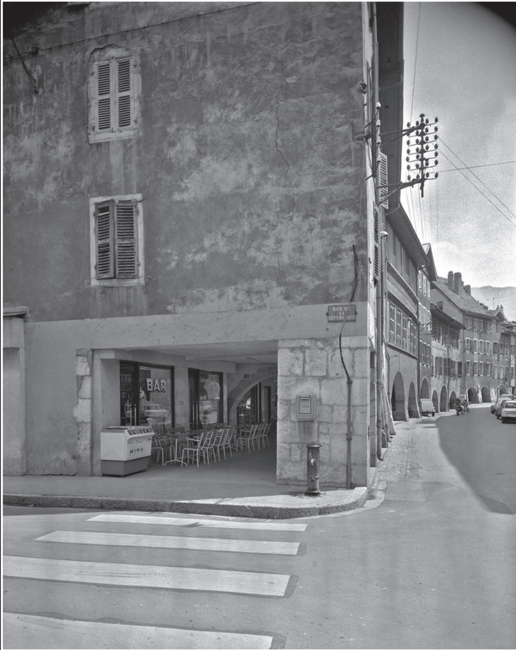
Le côté pair de la rue Sainte Claire