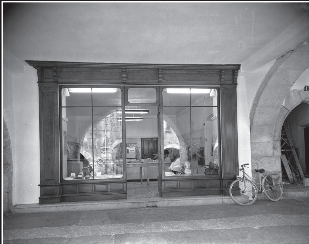
Triperie VIDON, de 1930 à 1993 (Gabriel / Marcel / Jean)