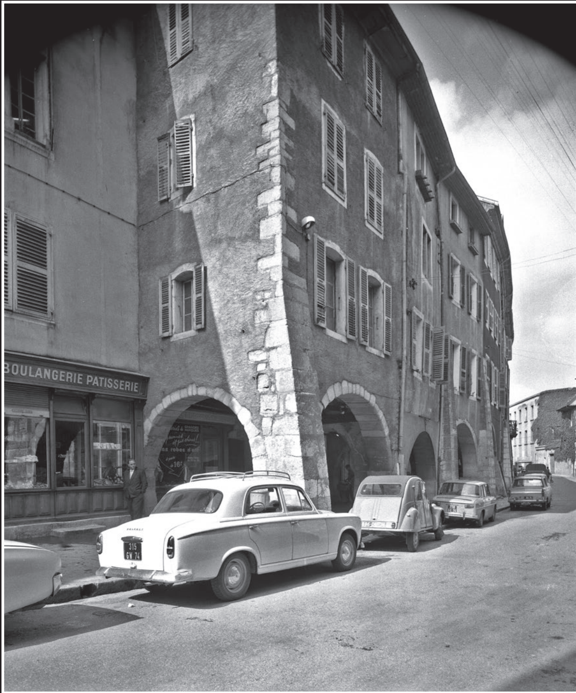
La rue Sainte Claire avec la manufacture de coton