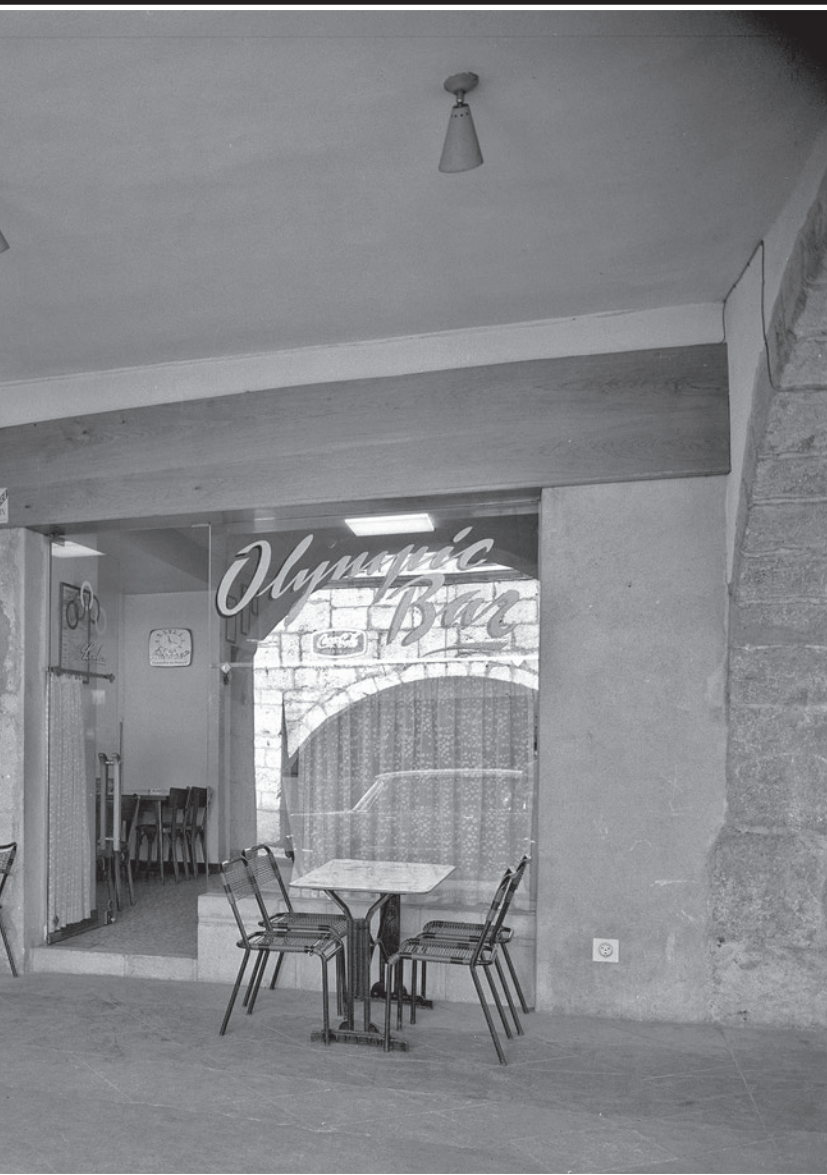
L'OLYMPIC BAR, Loulou BLISSON & Thérèse LARAVOIRE